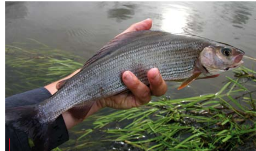
Vlagzalmen zijn en blijven prachtige vissen!

Stroomafwaarts van Ansanger slingert de Ansanger Å zich door een prachtig Engels aandoend landschap. Mooie grote bomen, direct langs het water. De gids vertelt dat meeste Deense vissers zich vooral richten op de zalm en dat ze de bovenlopen met forel en vlagzalm een beetje links laten liggen. Dat vinden wij niet erg, want dan is het er niet zo druk. Ook hier is het lastig vissen door het hoge water. Slechts sporadisch stijgt er een vis. In de middag zitten we langs het water met de gids wat bij te praten, als er plots 10 meter stroomopwaarts een vis begint te stijgen. Toch maar even proberen. Bij de tweede worp wordt de Elk Hair Caddis van het oppervlak gegrast. Een mooie vlagzalm blijkt verantwoordelijk. Vlagzalmen zijn en blijven prachtige vissen! Volgens onze hebben we wat pech met het weer. Door de regen is het water hoog en troebel. Normaal gesproken moet je hier meer en grotere vis kunnen vangen. Dat verhaal hoor je wel eens vaker van gidsen, maar in dit geval geloof ik hem wel.