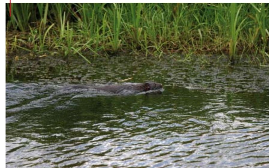
Ondertussen genieten van de capriolen van een otter.