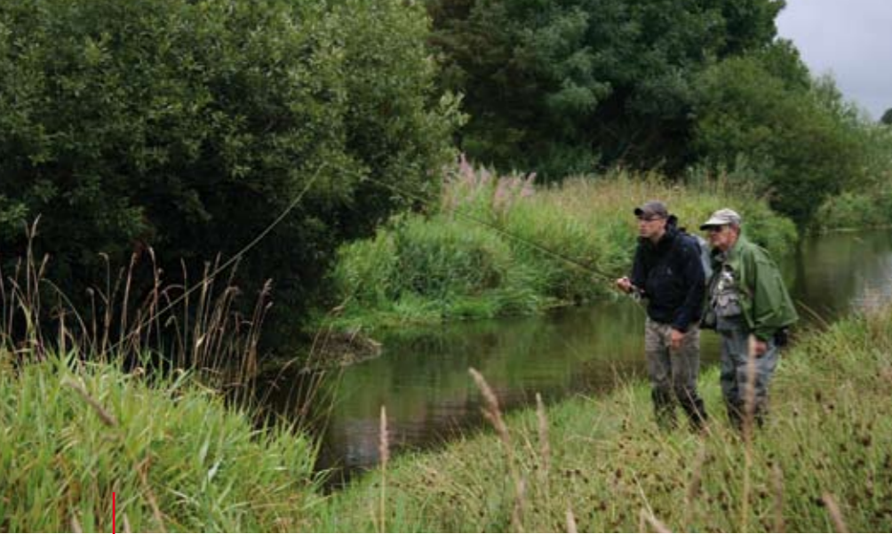
De gids vist stroomafwaarts met de nimf, maar Lex zal toch eigenwijs stroomopwaarts blijven vissen.

door het hogere water is het lastig te bevissen. De oevers zijn erg drassig en sterk begroeid. Daarom is een iets langere hengel van bijvoorbeeld 9 voet gemakkelijker. Dan zit je niet zo gauw vast. Ik gebruik meestal een AFTMA 4, maar een AFTMA 3 kan ook prima. Vis niet met een te dunne punt. Want de vis kan zo in de planten schieten en een dunne lijn breekt dan